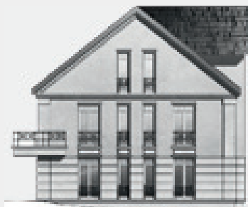
Anno 2014 Seitenansicht

Insgesamt ohne jeden Zweifel eine ideale Umgebung für ein hochwertiges stilvolles Familiensitz!