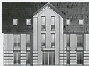
Anno 2014 Eingang